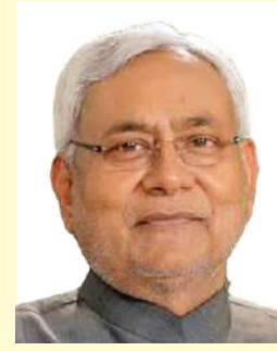
श्री नीतीश कुमार माननीय मुख्यमंत्री, बिहार