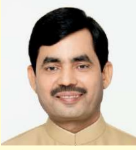
सेयद शाहनवाज हुसैन माननीय मंत्री उद्योग विभाग, बिहार सरकार